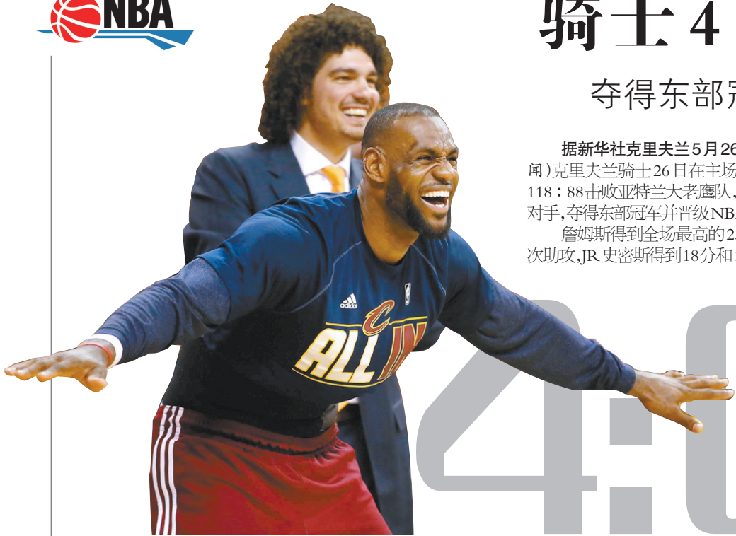
5月26日,骑士队球员詹姆斯在场边为队友加油。