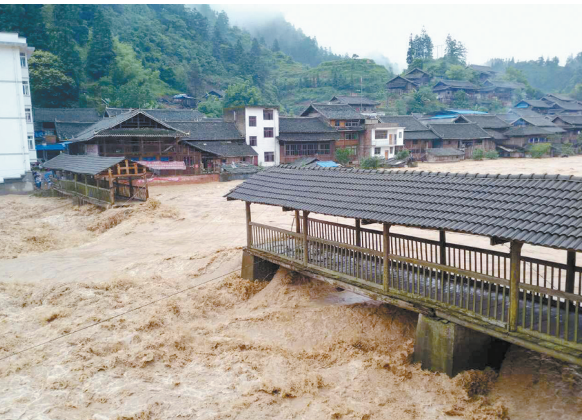
5月27日,贵州省榕江县两汪乡两汪花桥被洪水冲断。

新华社贵阳5月27日电 (记者杨洪涛 李春惠)26日20时至27日,贵州出现强降雨天气过程,其中包括黔东南州雷山县在内的部分地区遭受特大暴雨袭击并引发洪涝灾害。 据悉,这一轮强降雨贵州有5个乡镇出现特大暴雨,其中降雨量最大的雷山县大塘镇达到367.6毫米。 据初步统计,截至5月27日15时,暴雨已造成贵州雷山、剑河、凯里、西秀等9个县(市、区)受灾,受灾人口4.9万多人,紧急转移安置596人,农作物受灾1790公顷,部分民房倒塌或严重损坏。 记者27日下午赶到灾情较重的雷山县,了解到因强降雨导致境内河流水暴涨,多个乡镇不同程度受灾,交通、通信、电力、供水等基础设施受损较重;县城上游在建的鸡鸣水库水位一度出现险情,全县动员群众紧急避险3万余人,救援被困人员60余人。县城供电供水中断,经过抢修,目前县城已部分恢复供电,供水设施正在抢修。