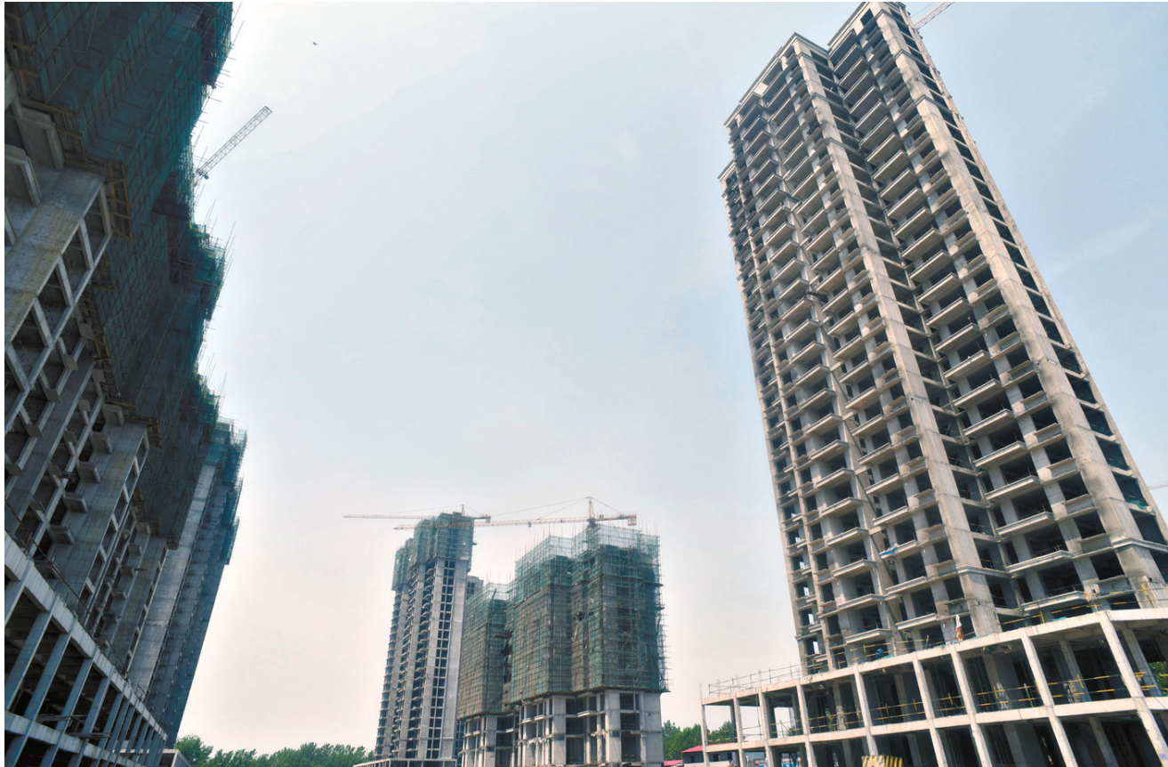
城中村旧貌换新颜