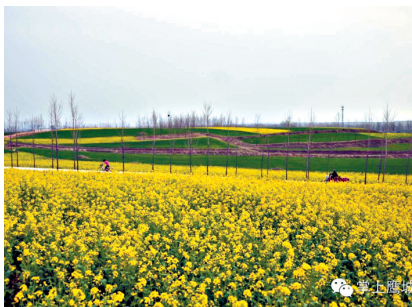
春回大地