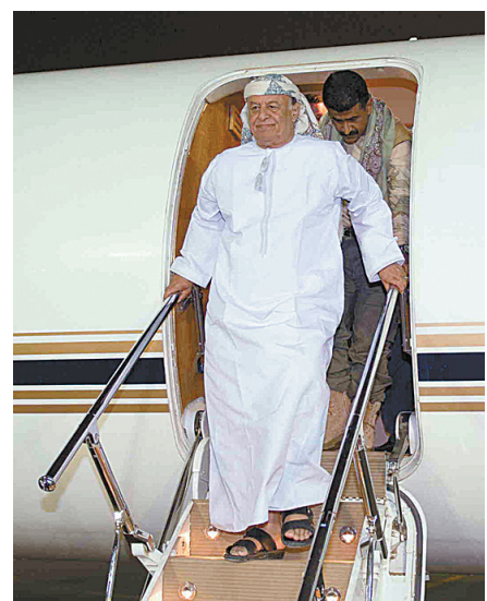
3月26日,也门总统哈迪抵达沙特利雅得空军基地。