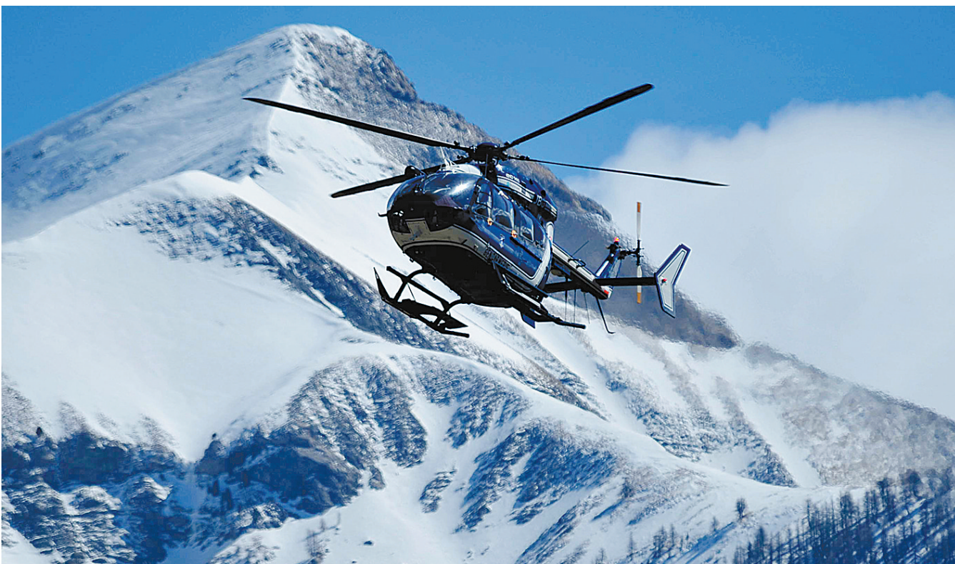
3月26日,在法国南部阿尔卑斯山区,一架直升机飞往德国之翼航空公司客机失事地点实施搜寻工作。

综合新华社3月27日电 法国总理瓦尔斯27日说,目前有足够材料证明,德国之翼航空公司失事客机副驾驶员的蓄意行为造成了飞机坠毁。