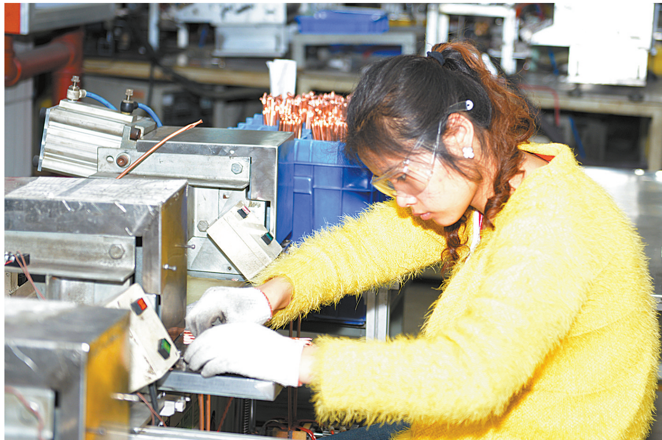
3月27日,一位工人在热导管生产线上加工产品。位于平新产业集聚区的平顶山业强

据了解,近年来,舞钢市广泛开展志愿者服务活动。其中“生态文明建设、清洁家园行动”等主题活动,成为提升广大市民素质、传递社会正能量的助推器。许多人自愿加入志愿者行列,成为传播文明、共创和谐的使者。据该市文明委统计显示,实名注册的志愿者已有95个团体、1.2万多人。 据该市文明委负责人介绍,从今年3月开始,开展每周集中志愿服务活动。每周确定一个单位牵头,找准服务项目,共同参与集中服务活动。志愿服务活动要运用群众乐于参与、便与参与的方式,显现出它的广泛性、群众性。广大党员要自觉无偿服务群众、奉献社会,积极认领服务项目,选择志愿服务团队,根据自己的专长提供个性化志愿服务。