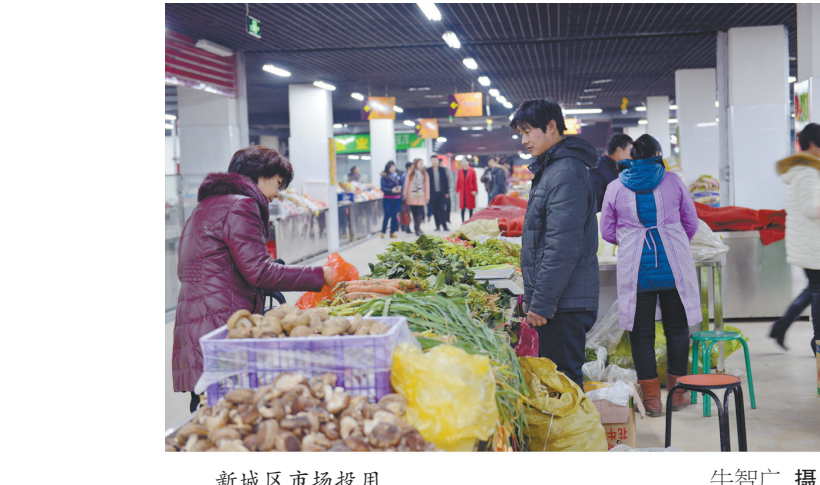
新城区市场投入使用