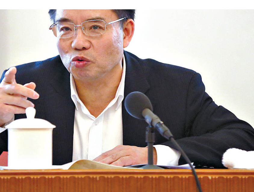
▲全国政协委员王富玉提出，应继续大力促进农业产业化，加大对农民培训力度，打造专业农民队伍。

新华社北京3月9日电 今年上半年，国务院教育督导委员会办公室就职业教育的发展规划与体制机制创新等16项内容，在全国组织开展专项督导检查。这是2014年全国职业教育工作会议后，首次在全国范围内开展的职业教育专项督导检查。 记者9日从教育部获悉上述情况。国务院教育督导委员会办公室近日已印发《关于开展职业教育专项督导检查工作的通知》。通知明确，专项督导将从地方政府对职业教育的战略摆位、体系建设、行业企业参与、质量提高、政策保障等五个方面入手，重点围绕各地关于职业教育的发展规划与体制机制创新、中高职课程体系衔接与招生考试制度改革、现代职业学校制度与学徒制度的建立和完善、“双师型”教师队伍与职业教育信息化建设、经费保障体系与资助政策体系建设等16项内容开展专项督导检查。 通知要求，各地要结合本地实际，逐级开展自查。国务院教育督导委员会办公室将根据各地自查情况，于5月下旬或6月组织督导检查，对部分省市区进行督导检查；督导结束后，将形成专项督导报告向全社会公布。