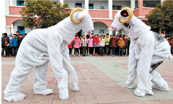
3月9日，枣庄市齐村镇乔屯村的小学生们展示寒假期间学到的“斗羊”技艺。