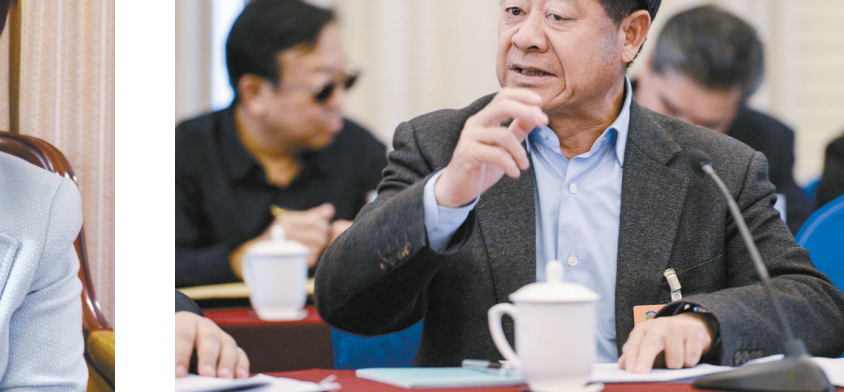
▲全国政协委员王富玉提出，应继续大力促进农业产业化，加大对农民培训力度，打造专业农民队伍。