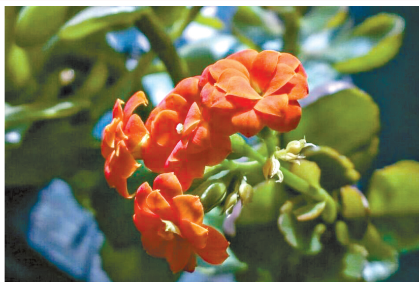
花朵朵朵