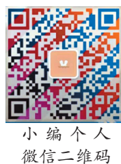
小编个人微信二维码