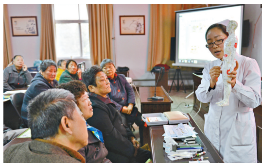
开展糖尿病健康知识宣传

2014年,我市县级公立医院综合改革扎实推进。17家县级公立医院严格执行药品零差率销售政策,深入推进补偿机制、管理体制和人事分配制度改革,初步建立了运行新机制。舞钢市、郏县、宝丰县、叶县等地实行“先住院、后付费”服务模式,受益群众达8.24万人。推行按病种付费,开展总例数1.97万。建立绩效考核制度,在职工平均工资达3213元,比改革前增长35.23%,提高了职工积极性。