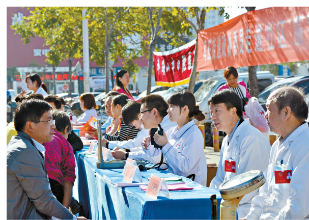
医护人员进社区服务居民