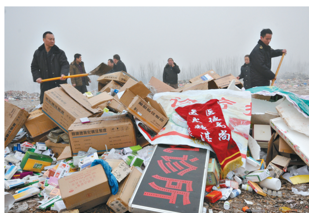
集中销毁非法药品