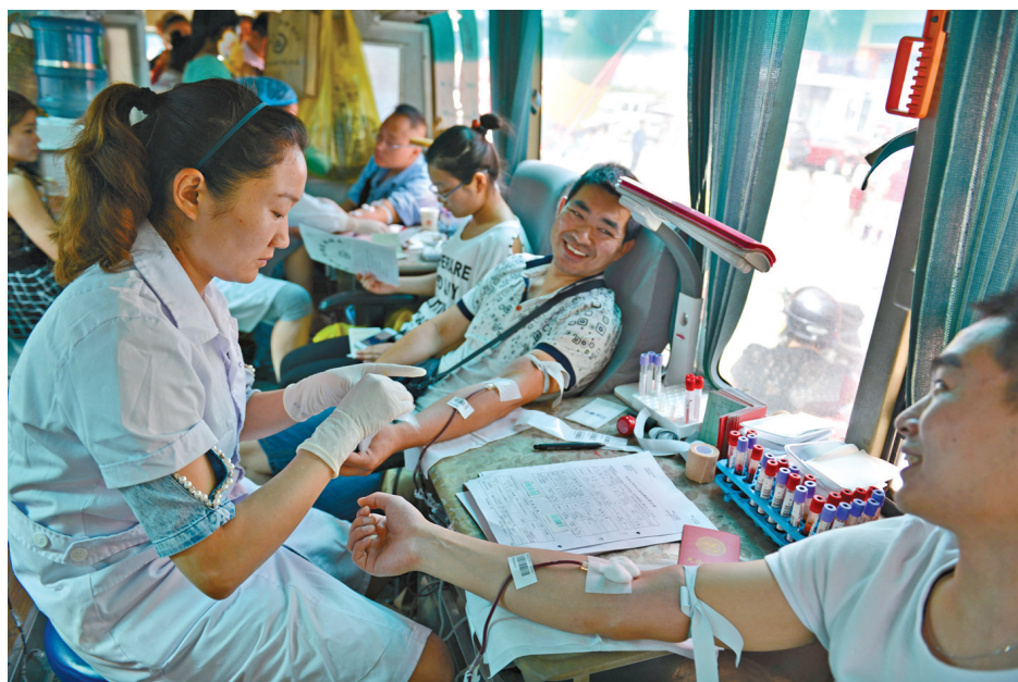
积极参与无偿献血

2014年,我市医疗卫生服务体系更加健全。共争取中央投资项目7类202个,投资额达2.33亿元,其中市精神卫生中心主体完工,市第二人民医院全科医师培训基地开工建设,一批基层医疗卫生机构建设有序推进。卫生信息化建设取得新进展,区域卫生信息平台基本建成,已发放居民健康卡2832张,郏县作为优秀典型在全国居民健康卡推进会上被表扬。