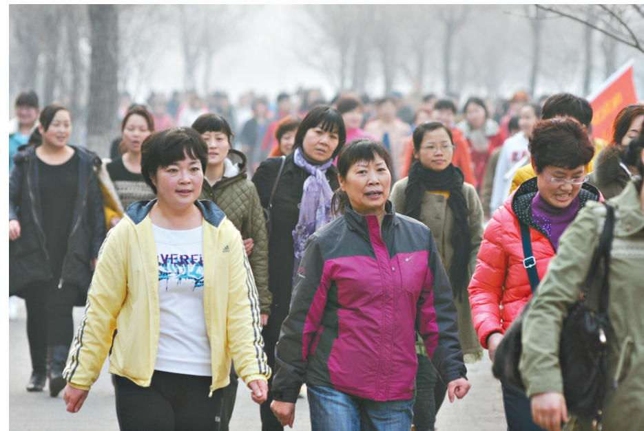
医患共同健康走、庆三八