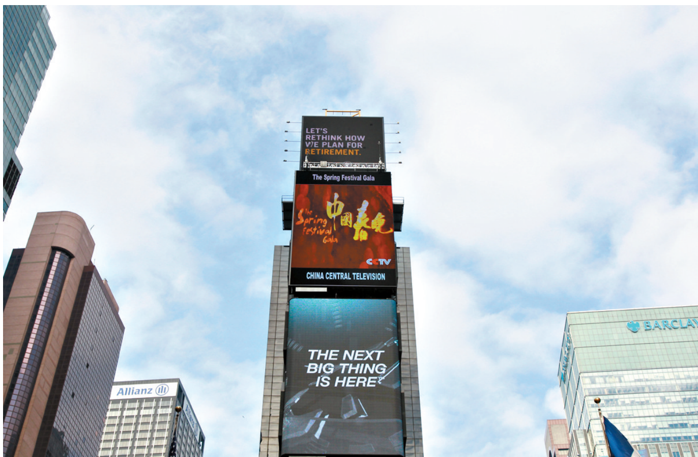
春晚宣传片首次亮相纽约“中国屏” 2月12日,美国纽约时报广场的“中国屏”播放中央电视台春节联欢晚会宣传片。被誉为全球华人“年夜饭”的中央电视台春节联欢晚会宣传片12日首次亮相纽约时报广场“中国屏”,让美国民众近距离感受到中国春节传统的文化气息。

动员社会力量捐助,为医疗救助筹措更多资金;健全“求助有门、救助及时”机制,强化“救急难”功能,就是让困难群众有病治疗时求助能找到地方,现在部署的主动救助也是要通过排查,对困难群众建档,掌握情况。 关于健全“一站式”即时结算机制,窦玉沛表示,要为困难群众医疗救助提供便利,困难群众看完病,除去负担应负担部分,其他的医疗保险、大病保险和医疗救助一并通过信息系统随时结算,做到随来随治、随治随结、随结随走。健全制度衔接机制,则是要实现基本医疗保险、大病保险、补充医疗保险、医疗救助和慈善救助的衔接。