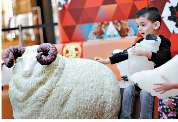
世界各国的中国年 2月12日,在加拿大温哥华,一名儿童被小羊灯笼吸引。为迎接新春来临,温哥华一个商场举办羊灯笼装置艺术展。共180个不同造型的羊形灯笼摆放在商场内的主要通道上,为民众带来羊年新春气氛。