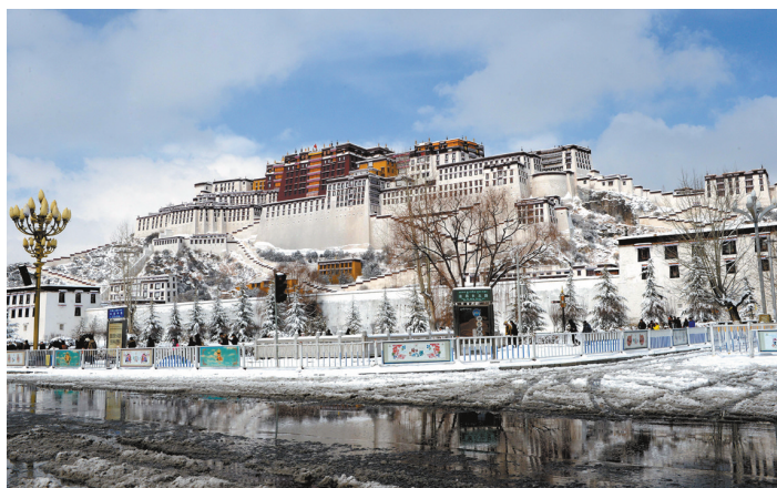
拉萨迎来近20年来最大降雪 这是雪中的布达拉宫(2月13日摄)。当日,拉萨降雪。据西藏自治区气象台消息,截至11时,降雪量已达17.3毫米,为拉萨近20年来最大的一场降雪。

据新华社北京2月13日电(罗沙 邹伟)最高人民法院13日开通了全国法院减刑、假释、暂予监外执行信息网,确保“减假暂”案件办理的公开公正,保障社会公众的知情权、参与权和监督权。 据介绍,人民法院受理“减假暂”案件后,除依法不公开的案件外,一律在立案后五日内将执行机关报请减刑、假释的建议书或者被告人及其辩护人的暂予监外执行申请书在信息网上进行公示。社会公众通过上网查询,便能准确掌握人民法院受理“减假暂”案件的具体情况。 对于人民法院决定公开开庭审理的“减假暂”案件,一律