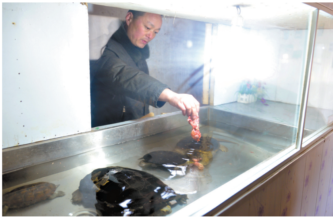
1月23日，市动物园工作人员给保温圈舍内的鳄鱼龟投喂食物。

据晚报报道，市动物园相关负责人在接受记者采访时说，他们一年收容20多只鳄鱼龟，“再按这样的速度收养，负担真的不小”。据园方分析，近年鳄鱼龟收容量突然增长有多方面的原因，其一是有些人购买后想放生，在了解到鳄鱼龟是外来物种，放生会破坏生态环境后，求助园方收容；其二是鳄鱼龟生长快，市民家饲养空间不够，或怕它太凶伤人，但又不想送人或食用，就希望由动物园收养它。