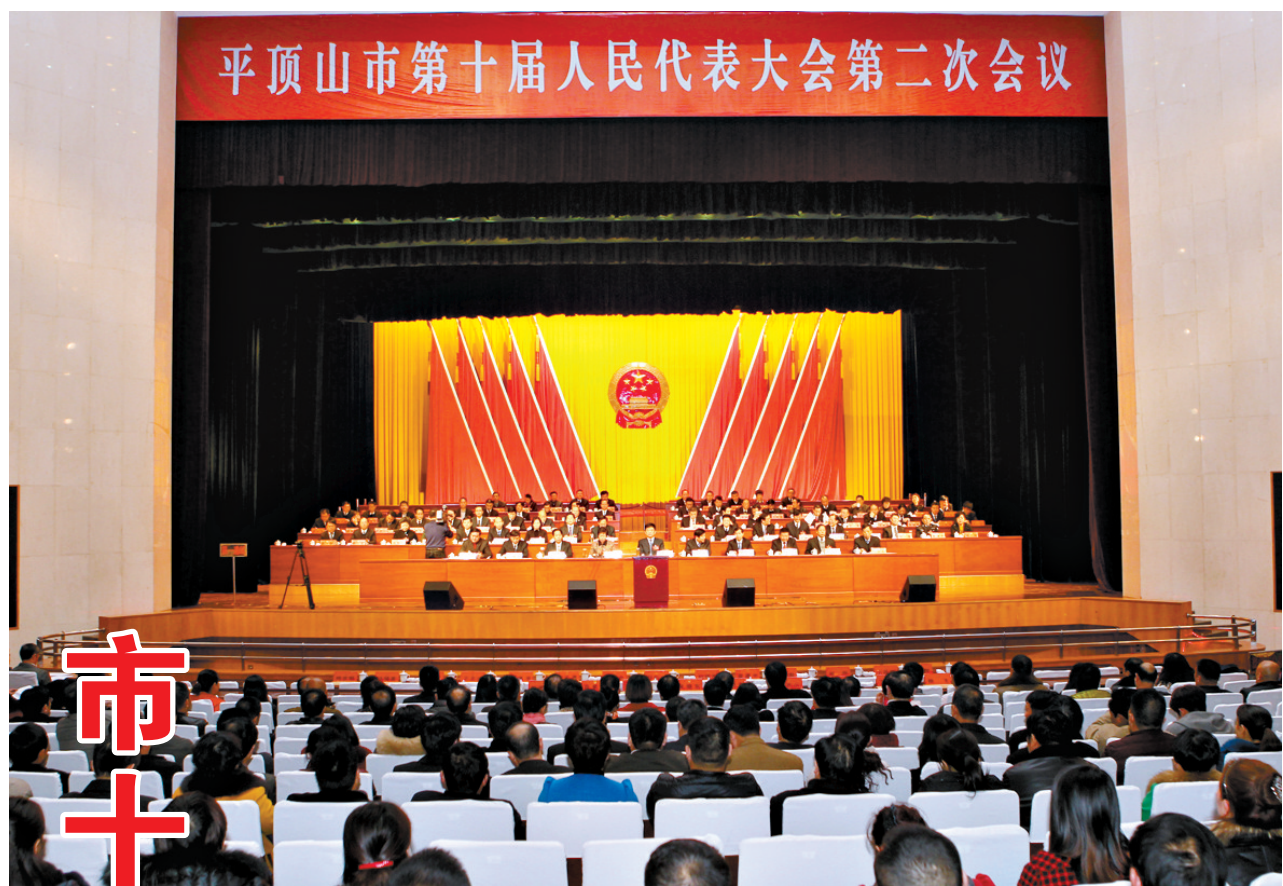
1月23日下午,平顶山市第十届人民代表大会第二次会议闭幕。

2015年1月24日 星期六 甲午年十二月初五 中共平顶山市委机关报 平顶山日报社出版 国内统一刊号 CN41-0005 第10748期 新闻热线 4944764 网址: http://www.pdsxww.com 今日4版