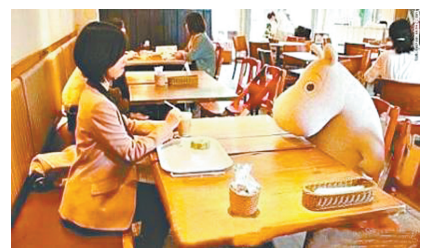
在日本有一家咖啡厅怕顾客一人用餐孤独尴尬,放了一些毛绒玩具陪顾客,感觉好贴心。——@中国新闻网