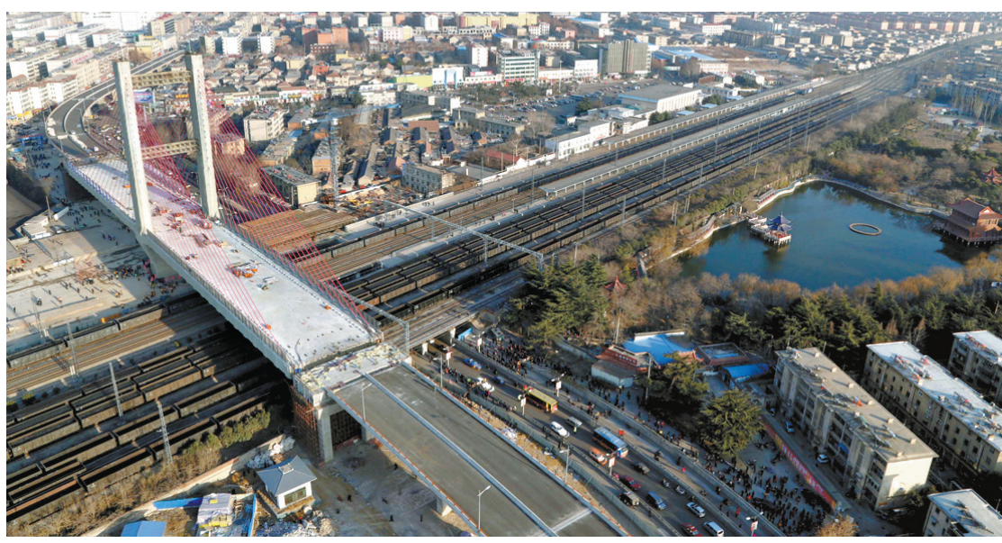
正在进行转体作业的桥梁横跨京沪线(1月19日摄)。当日,山东邹城市三十米上跨京沪线转体桥成功转体97.3度,与边跨现浇段合龙。转体桥横跨京沪铁路站场14股道线,全长1198.5米,主桥转体重量2.24万吨,是目前世界上最重要的转体桥。