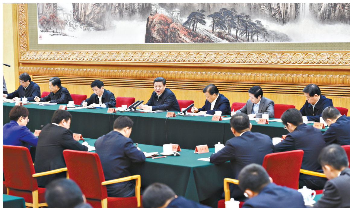
1月12日,中共中央总书记、国家主席、中央军委主席习近平在北京主持召开座谈会,同中央党校第一期县委书记研修班学员进行座谈并发表重要讲话。

习近平认真听取他们的发言,不时记下要点,不时插话,就一些问题进行深入探讨,座谈会气氛热烈。