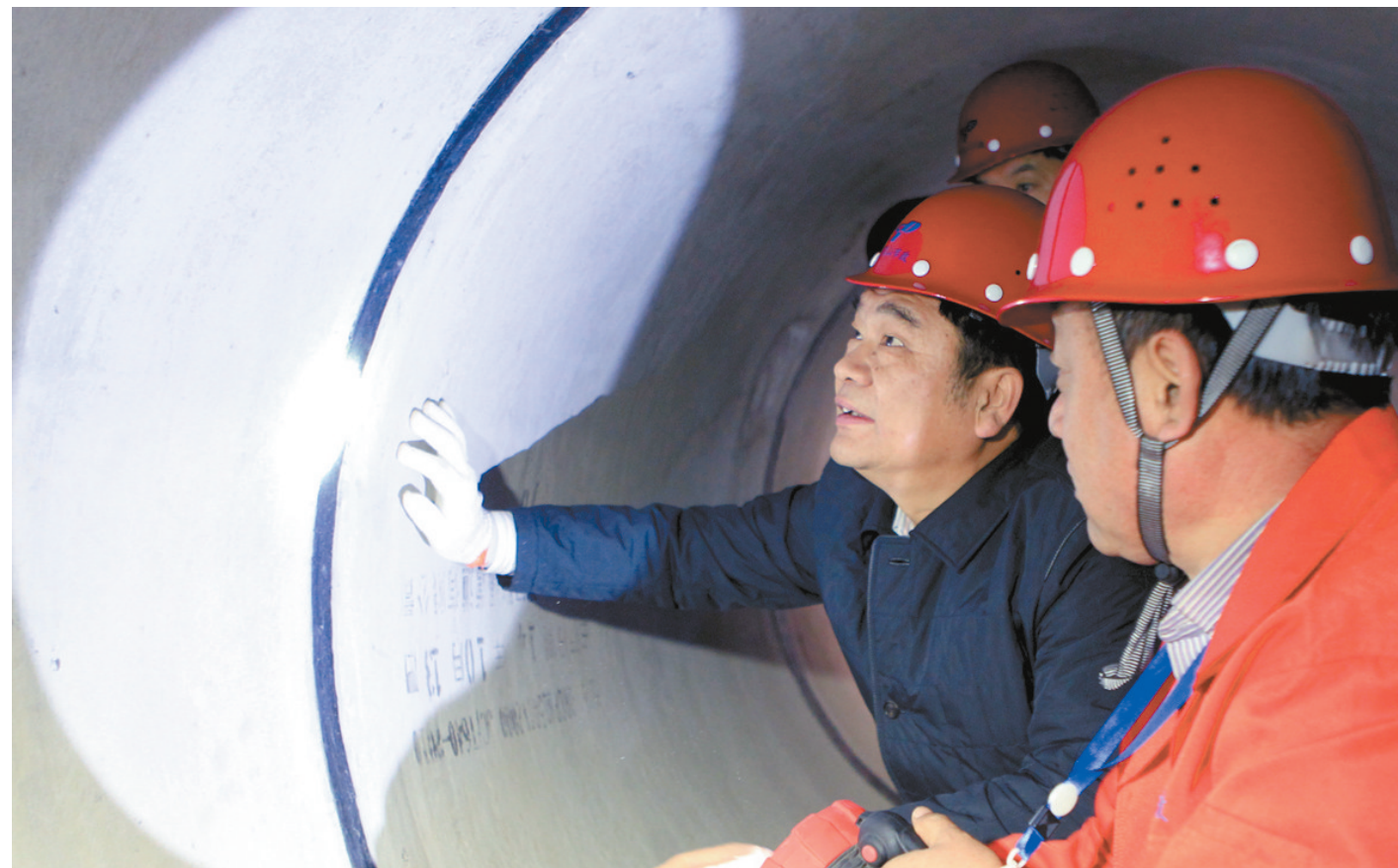
1月8日,市委书记陈建生在混凝土排污管道内认真检查管道工程质量。