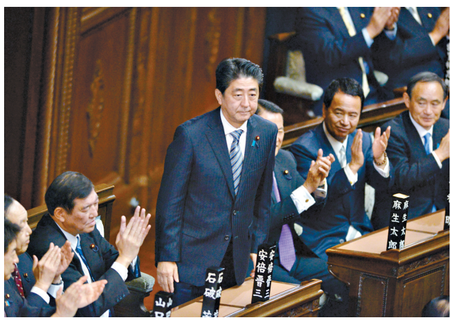
12月24日,在日本东京国会众议院,自民党总裁安倍晋三(中)当选日本首相后向议员致意。

综合新华社东京12月24日电 日本国会众参两院24日举行首相指名选举,执政党自民党总裁安倍晋三当选日本第97任首相。这是安倍晋三第三次当选日本首相。 日本国会众议院当天下午举行首相指名选举。在470张有效选票中,安倍获得328票。此后,参议院也举行首相指名选举,在240张有效选票中,安倍获得135票。 安倍晋三24日连任日本首相后立即组建新一届内阁,原防卫厅(防卫省前身)长官中谷元接替江渡聪德出任防卫大臣,其他阁僚得以留任。 当天下午,留任内阁官房长官菅义伟在新闻发布会上宣