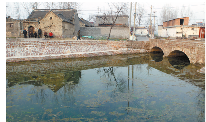
12月24日,村民们在起营泉旁聊天。宝丰县周庄镇马起营村是淇河的源头。今年以来,该县投资170多万元,挖掘泉眼、整治河道,使起营泉重现碧水。

本报讯(记者吴学清)12月24日上午,省委经济工作会议在郑州召开,我市组织收听收看。 当日上午,市委书记陈建生,市委副书记、市长张国伟在郑州主会场参加会议。市委副书记张遂兴,市委常委、常务副市长王丽,市委常委、组织部长段君海,市委常委、宣传部长唐飞,市委常委、统战部长黄祥利,市委委员、政法委书记王富兴,市委常委、副市长王宏景,副市长冯晓仙、郑理、李哲、崔建平、王鹏,市政协副主席、市发改委主任张弓等在平顶山分会场收听收看会议。各县(市、区)也组织收听收看了会议。