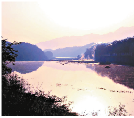
尧山福泉河