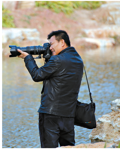
辛苦快乐的摄影人