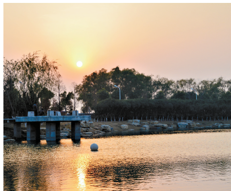
落日余晖