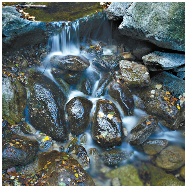
柔情似水