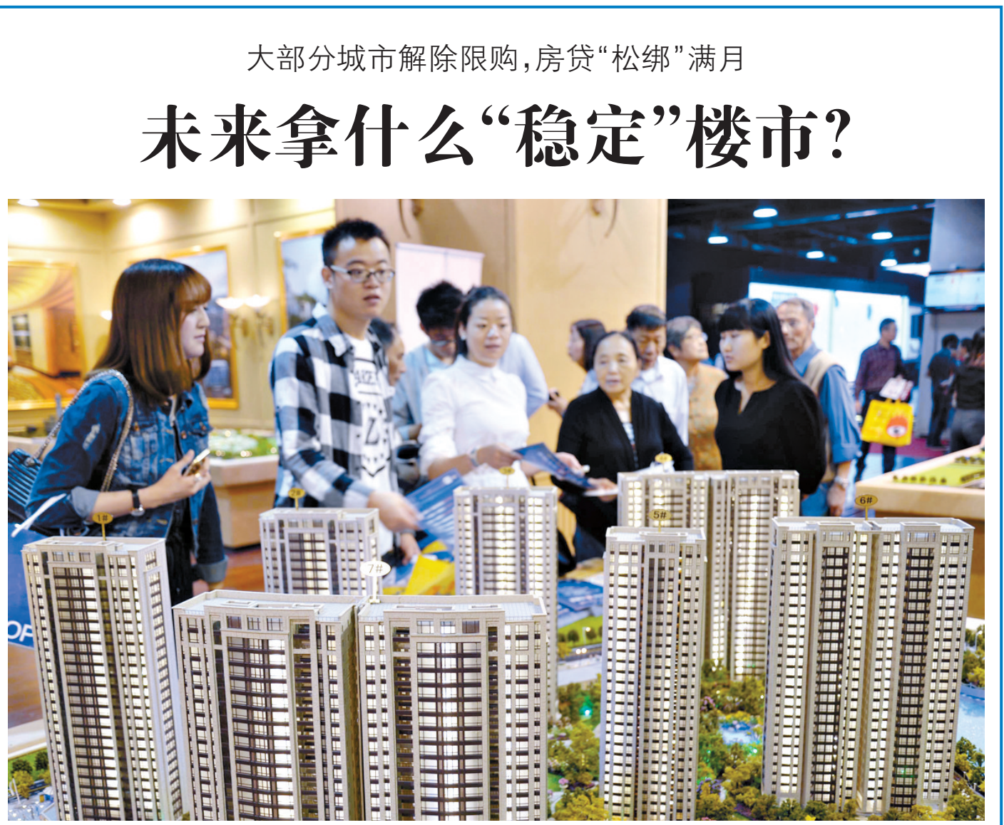
在浙江省第21届房地产博览会上,参观者在观看沙盘(10月24日摄)。

处理设施建设用地要按照土地管理法律法规的规定,优先予以保障。无害化处理设施设备可以纳入农机购置补贴范围。从事病死畜禽无害化处理的,按规定享受国家有关税收优惠。将病死畜禽无害化处理作为保险理赔的前提条件,不能确认无害化处理的,保险机构不予赔偿。 《意见》强调,要严肃查处随意抛弃病死畜禽、加工制售病死畜禽产品等违法犯罪行为,加强行政执法与刑事司法的衔接,对涉嫌构成犯罪的,依法需要追究刑事责任的,要及时移送公安机关。要建立责任追究制,严肃追究失职渎职工作人员责任。