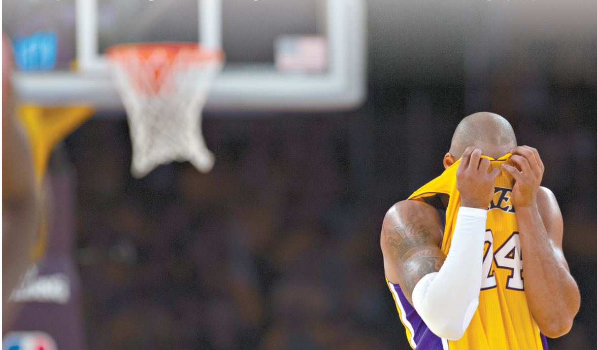
10月28日,湖人队球员科比在比赛中。当日,在2014/2015赛季NBA常规赛首轮比赛中,洛杉矶湖人队主场以90:108不敌休斯敦火箭队。

新华社华盛顿10月28日电 4个多月的休赛期结束后,2014/2015赛季NBA28日如期而至。卫冕冠军圣安东尼奥马刺队双喜临门,不仅领取了上赛季的总冠军戒指,还在揭幕战中主场以101:100险胜达拉斯小牛队,收获开门红。