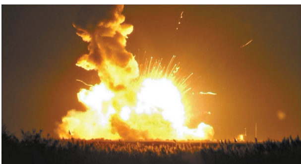
这是搭载“天鹅座”飞船的火箭升空爆炸瞬间的视频截图。

据新华社华盛顿10月28日电 (记者林小春)美国轨道科学公司28日向国际空间站发射“天鹅座”飞船,但火箭在点火起飞过程中爆炸。 美国航天局电视直播显示,美国东部时间28日18时22分(北京时间29日6时22分),轨道科学公司的“安塔瑞斯”号运载火箭起飞后6秒就在空中爆炸,爆炸的火箭落到发射台又再次引起爆炸。“天鹅座”飞船上携带近2.3吨的物资,但没有载人。