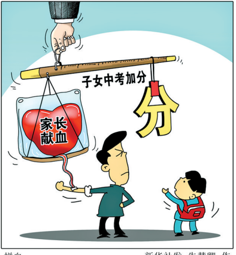
献血 朱慧卿 作

其二,将无偿献血这样的公益活动与中考分数挂钩,对中考而言有失公平。因为有的家长身体不适合献血,别人的孩子加了分,自己却只能眼巴巴地看着,客观上导致自己的孩子成绩“落后”。而有的同学学习成绩一般,但恰恰因为家长献血获得加分,排名可以上升很多,这对于其他同学而言是不公平的。