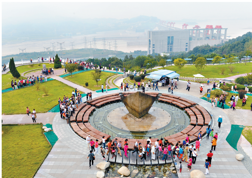
9月25日,游客在三峡大坝景区坛子岭园区游览。当日起,三峡大坝旅游景区对中国游客实行门票免费,涵盖的旅游景观包括坛子岭园区、185观景平台、截流纪念园。与此前收取门票时相比,游客游览方式、游览景点和游览线路基本不变。

据报道,近期,多家知名景区宣布上调门票价格。其中,丽江玉龙雪山门票由105元涨到130元,广东丹霞山门票由160元涨到200元。统计显示,国内5A级景区平均票价已迈入“百元时代”。专家指出,景区票价要体现公益性,应建立合理的票价生成机制,而长远来看,景区应摆脱门票经济依赖,谋求向产业经济的转型升级。希望有关部门尽早拿出切实可行的措施,让公共资源回归公益,别再让知名景区总是“趁火打劫”,沦为某些地方、部门甚至是个人的“摇钱树”。