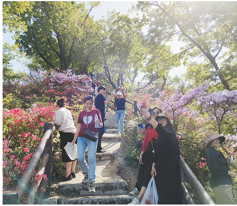
▼4月24日,第四届鲁山杜鹃花节开幕式歌舞表演 ▶游客在杜鹃岭上赏花游玩

四棵树下将以杜鹃花节为载体,着重展示云栖谷景区丰富的自然风光资源和文化资源,推动云栖谷景区进一步完善旅游基础设施,提升服务质量。同时,带动乡村旅游,以“文旅+农业+生态旅”培育旅游产业链条,着力推动农家乐及其他餐饮住宿行业、种植、养殖、手工业、旅游小商品零售等产业发展,全面转变经济增长方式、调整优化旅游产业结构,助力经济高质量发展。