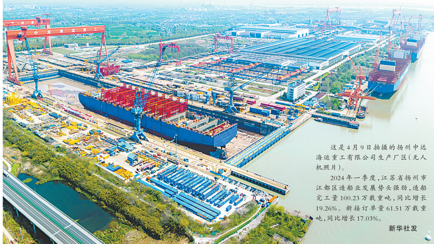
这是4月9日拍摄的扬州中远海运重工有限公司生产厂区(无人机照片)。

2024年一季度,江苏省扬州市江都区造船业发展势头强劲,造船完工量100.23万载重吨,同比增长19.26%。新接订单量61.51万载重吨,同比增长17.03%。