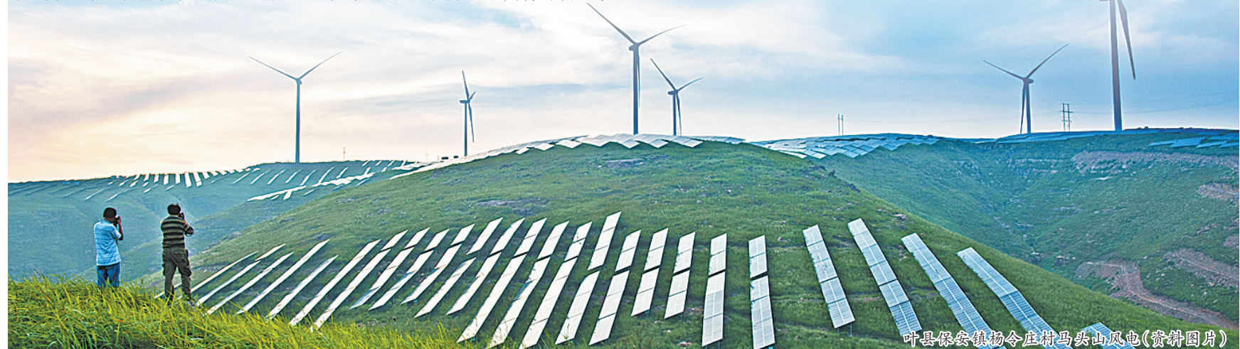
叶县保安镇杨岭庄村马头山风电(资料图片)