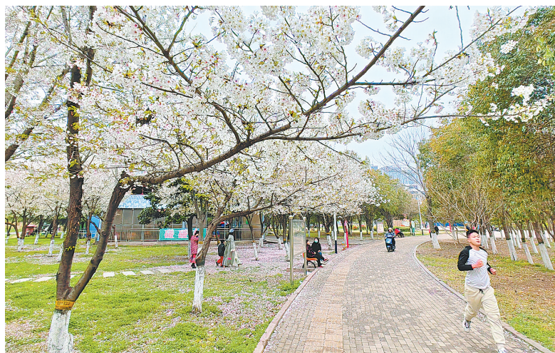
市民在落英缤纷的河滨广场健身、休闲