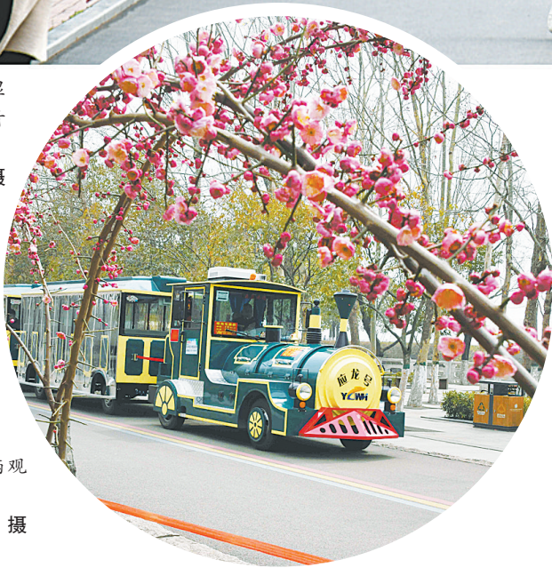
市民广场附近,一辆观光小火车穿梭在花丛中