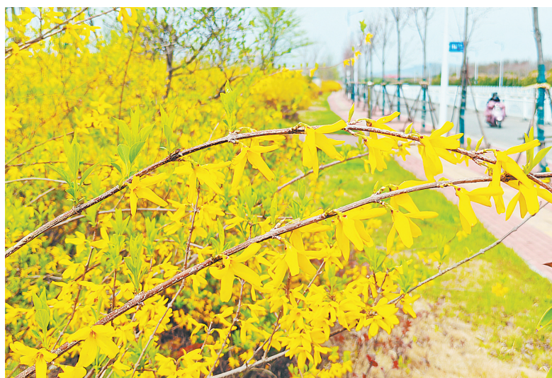
市区建设路西段一侧,连翘花怒放