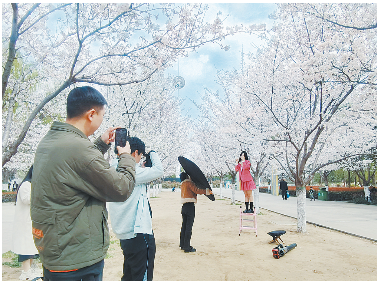
一名女孩在鹰城广场的樱花树下拍摄写真