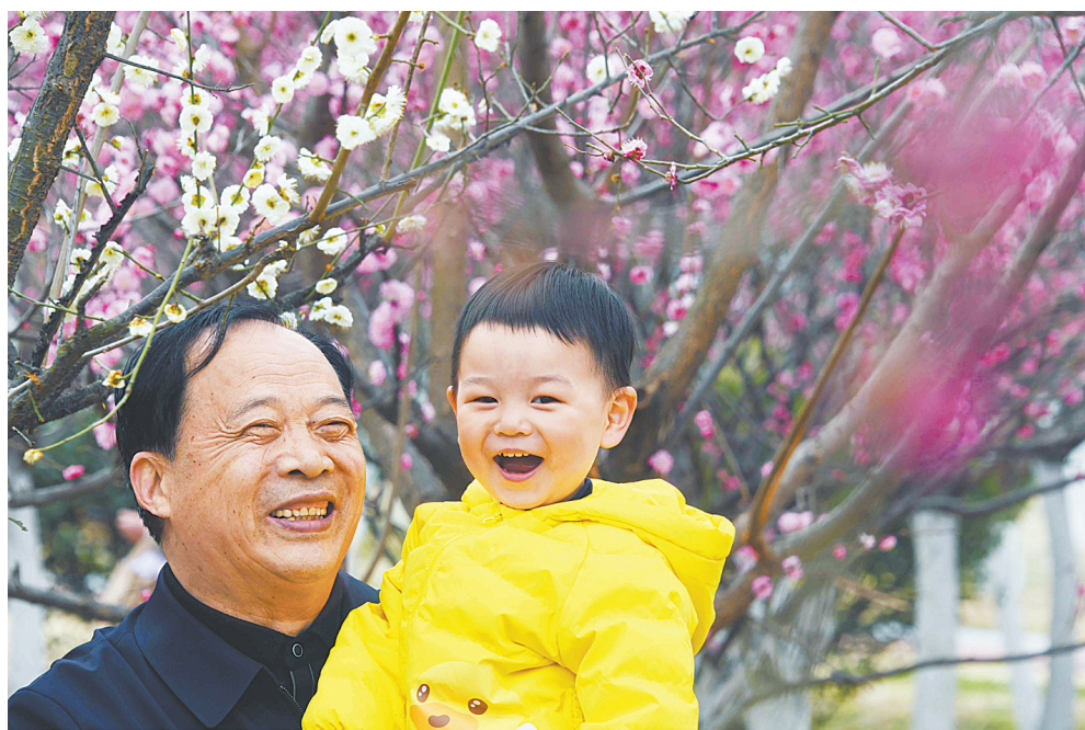
市民在白鹭洲国家城市湿地公园梅林中留影