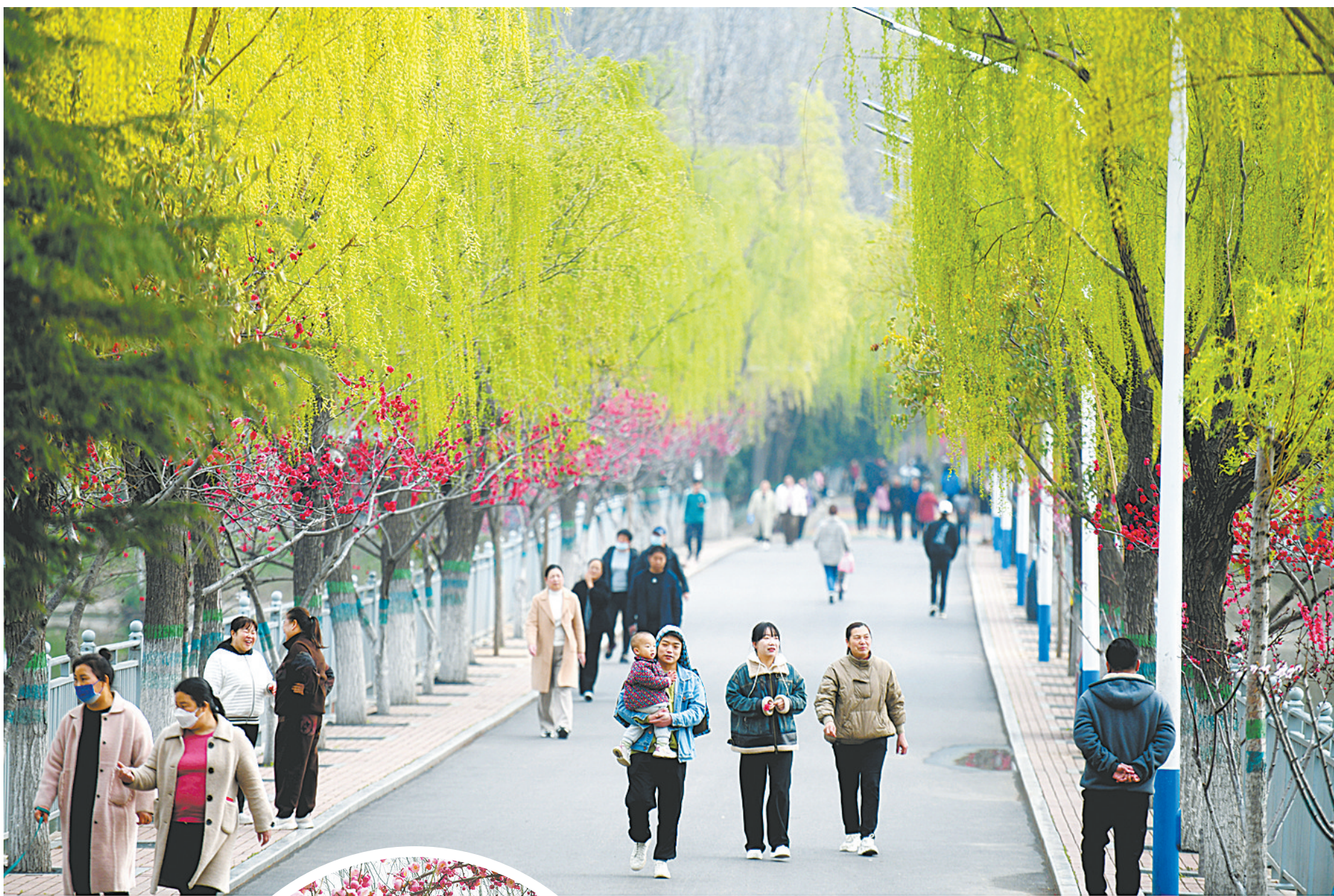
白鹭洲国家城市湿地公园火红的碧桃与青翠的杨柳相映成景