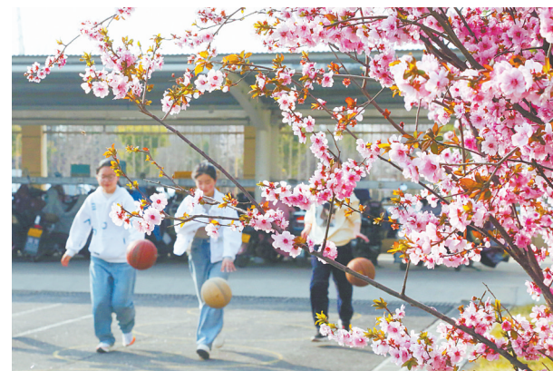
宝丰县贾府学校校园内的美人梅开放了