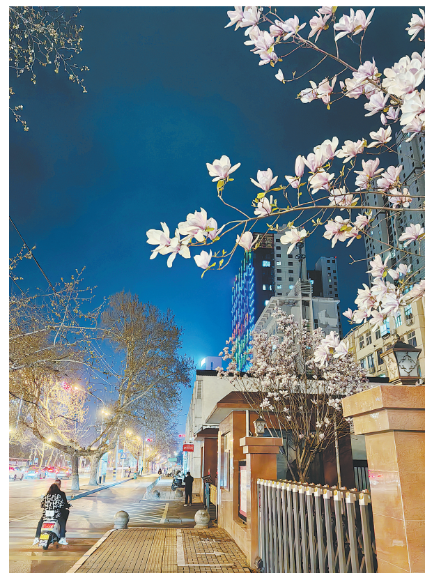
市区建设路中段的玉兰花悄然盛放,与夜色浑然一体,美轮美奂