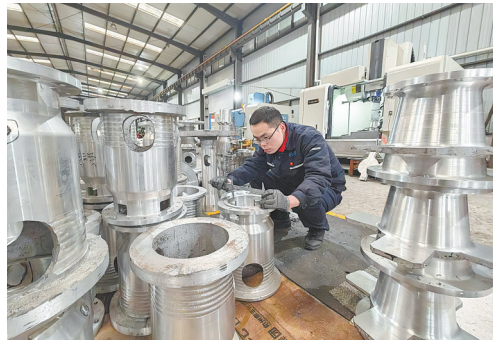
平顶山市海平电气有限责任公司员工在车间内进行工序检测