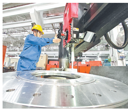
河南平高电力设备有限公司员工在生产电力设施配件