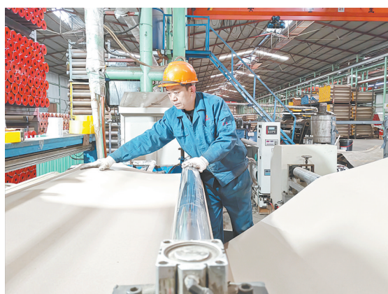
河南正鑫特种卷绕材料有限公司员工在车间内生产铜芯纸轴