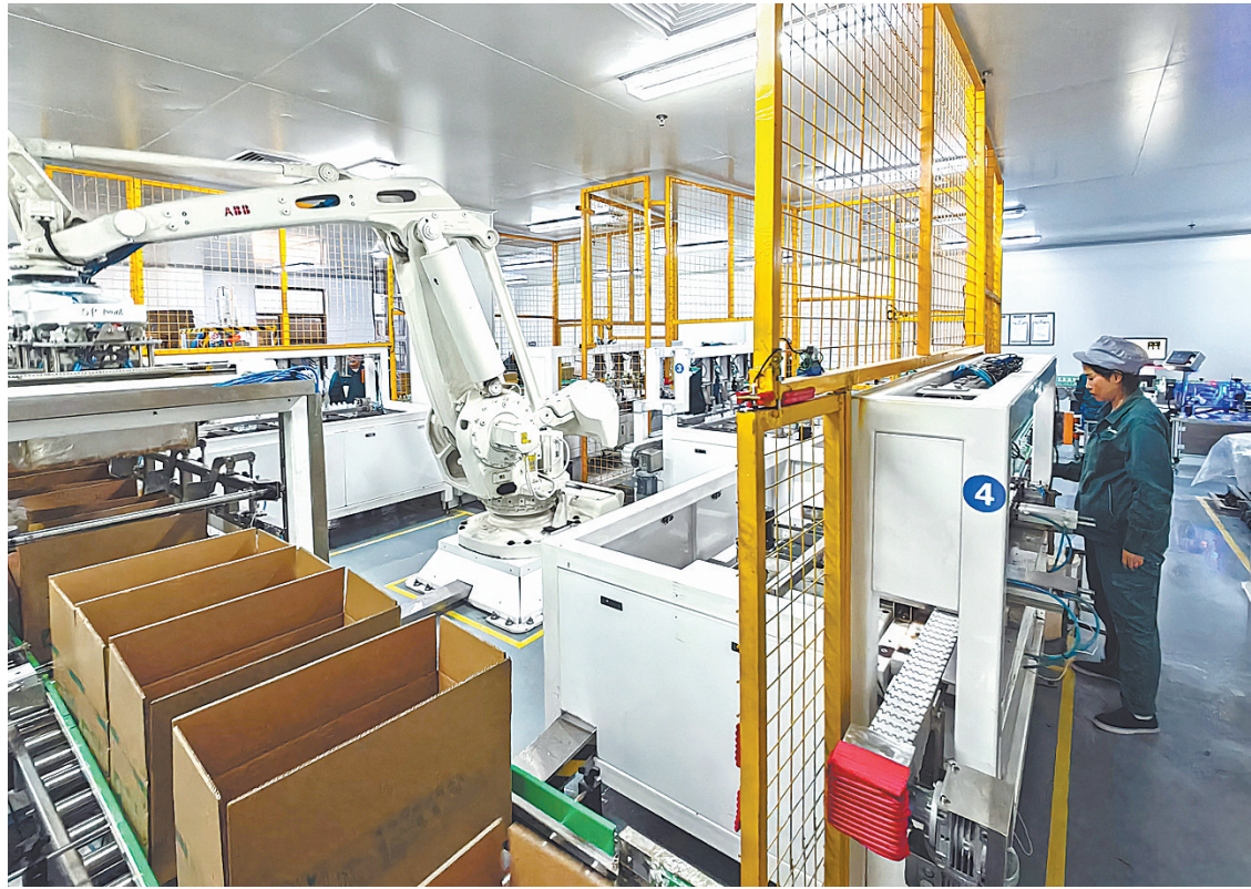
河南双鹤华利药业有限公司员工在生产输液瓶