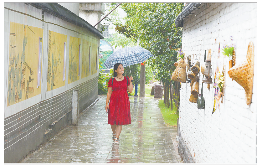
游客到湛河区曹镇乡谢庄村游玩(资料图片)

2023年,我市充分发挥独特的文旅资源优势,打造多元化、差异化、品质化的旅游产品,提供更加精细化的旅游服务,强力推进旅游品牌创建,全年共创建、提升国家级、省级旅游品牌45个、市级品牌14个。叶县县衙博物馆成功创建为国家4A级旅游景区,郟县唐钧传承文化苑成功创建省级工业旅游示范基地,宝丰杨沟村、鲁山汤