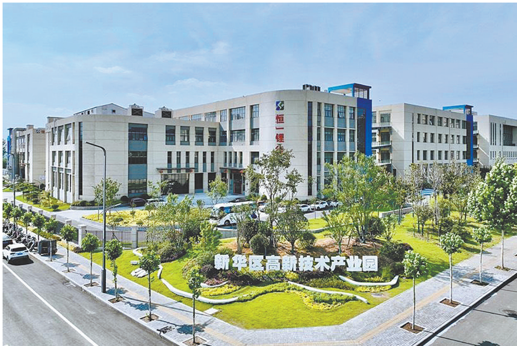
新华区高新技术产业园区一隅

9月22日,全市物业管理进社区交流学习观摩会在新华区召开。此前的9月16日,全市创建全国文明城市观摩会也在新华区举行,物业入驻社区是观摩内容之一。除了物业入驻,创文观摩会还重点学习了新华区城乡环卫一体化工作经验。结合我市“一部四沿五旁”集中清理整治活动,新华区将23个城市周边村统一打包,参照城